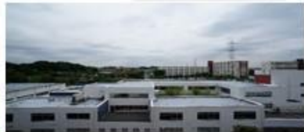
※南東側バルコニーからの眺望

小田急線「新百合ヶ丘」駅 バス6分 バス停「日本映画大学」下車 徒歩1分 / 「新百合ヶ丘」駅 徒歩20分