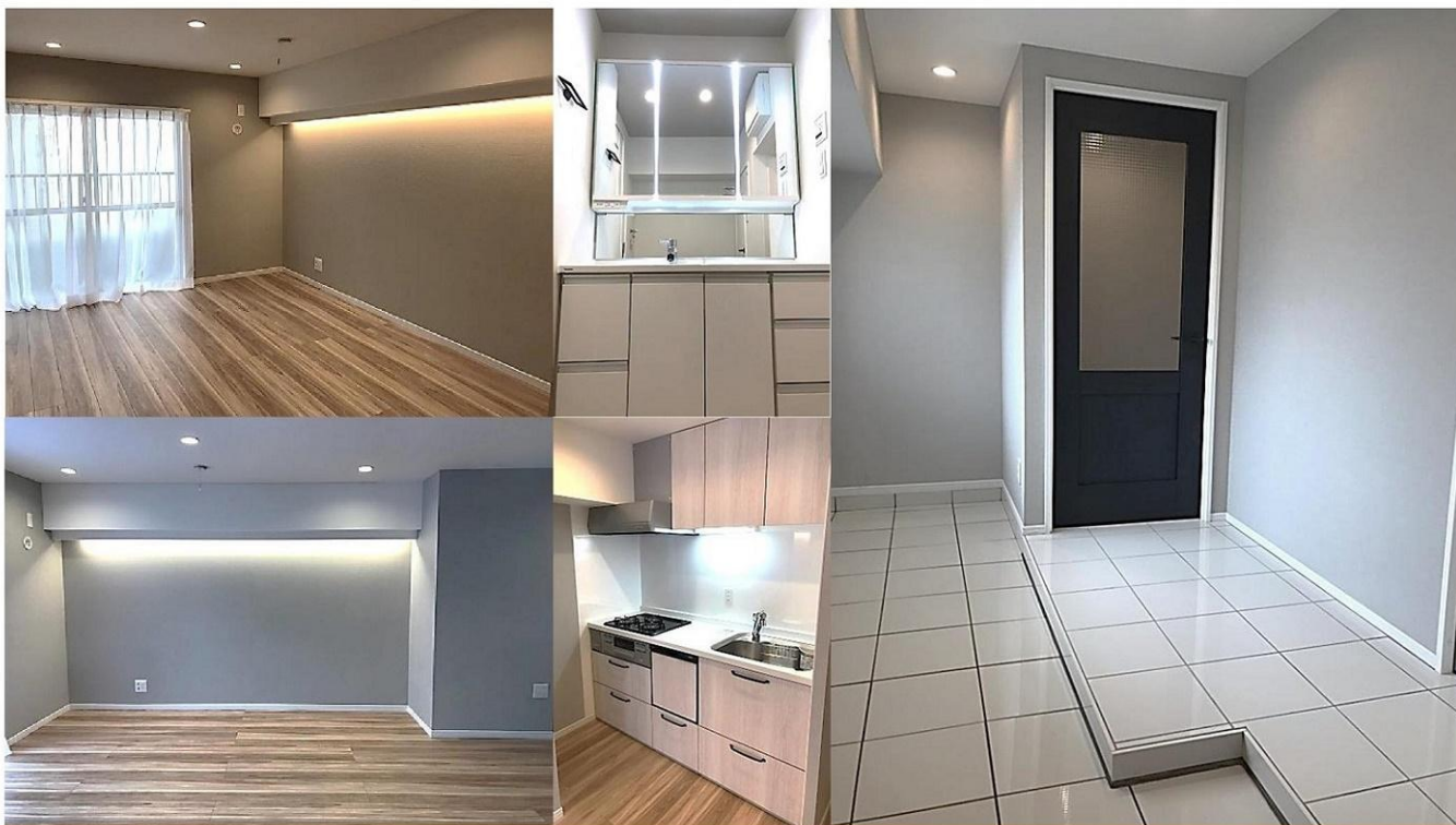
東急田園都市線「三軒茶屋」駅徒歩8分、東急世田谷線「西太子堂」駅徒歩5分