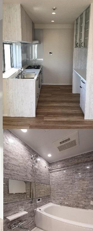
※室内写真準備中につき弊社施工例を掲載しております。

小田急線「新百合ヶ丘」駅 バス6分 バス停「日本映画大学」下車 徒歩1分 / 「新百合ヶ丘」駅 徒歩20分