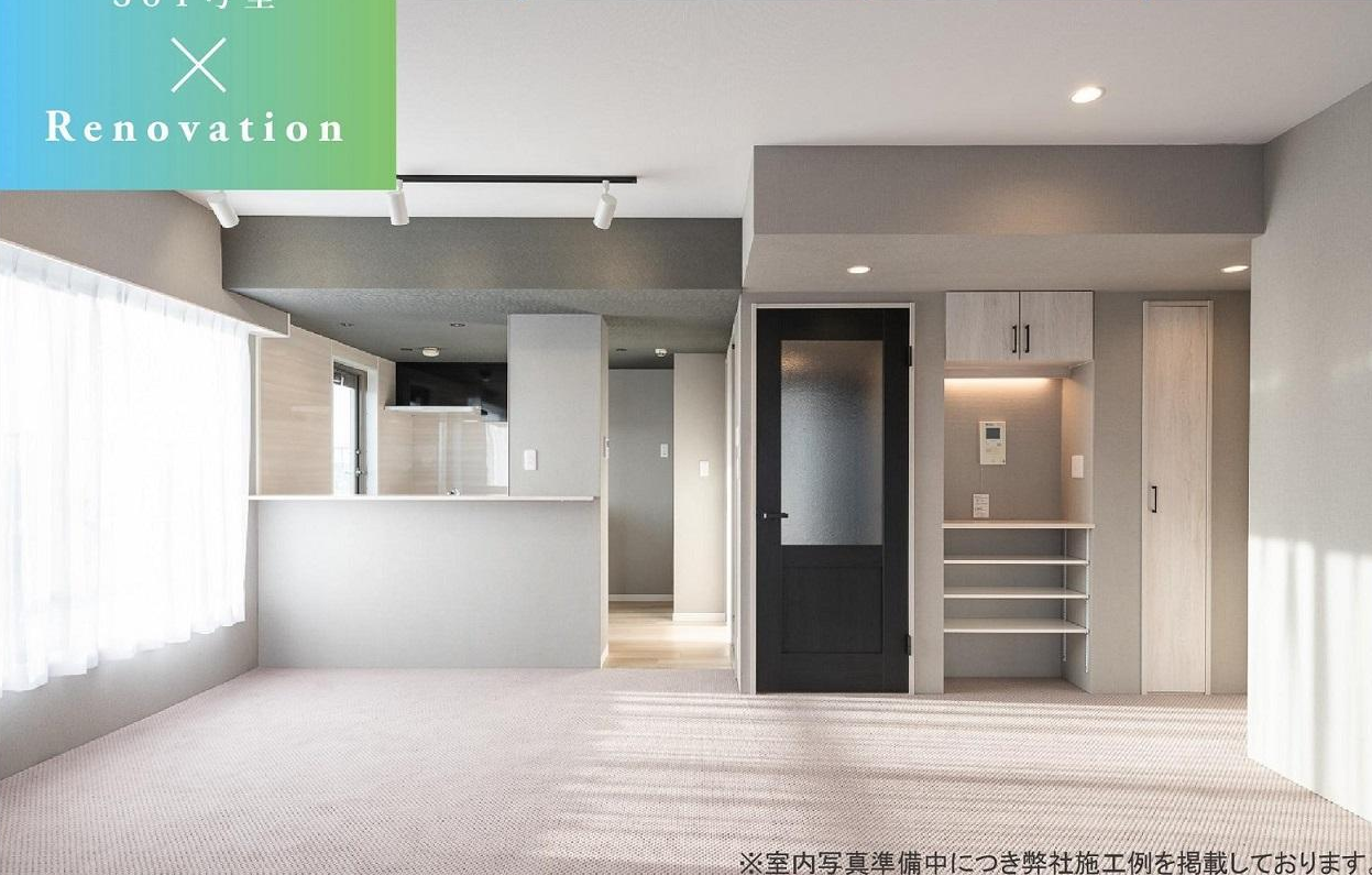
※室内写真準備中につき弊社施工例を掲載しております。