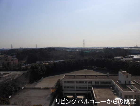
リビングバルコニーからの眺望